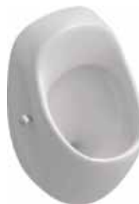
Omnia Pro 7507 00 xx